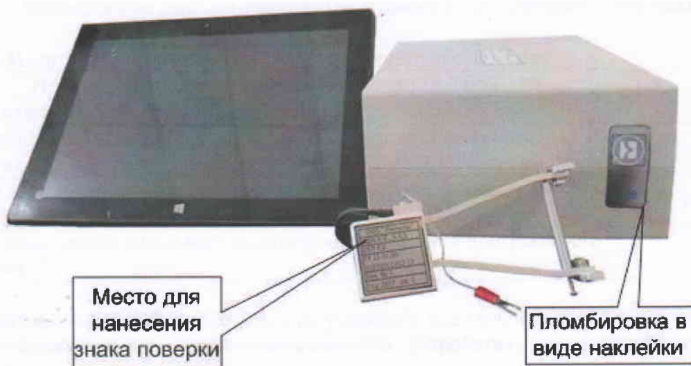
Рисунок 2 - Внешний вид измерителя с пультом оператора