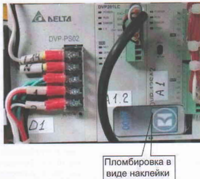
Рисунок 3 - Схема пломбирования электронной части измерительного блока от несанкционированного доступа