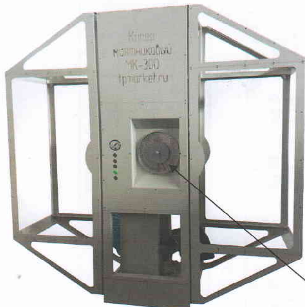
Рисунок 2.3 - Модель МК-300 с пневмо-подъемом молота. Модификация панели оператора вид 1