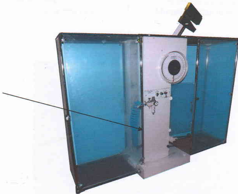
Рисунок 2.2 - Модель МК-300 с пневмо-подъемом молота

Место нанесения знака поверки и утверждения типа