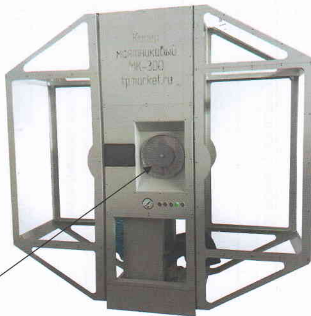
Рисунок 2.4 - Модель МК-300 с пневмо-подъемом молота. Модификация панели оператора вид 2