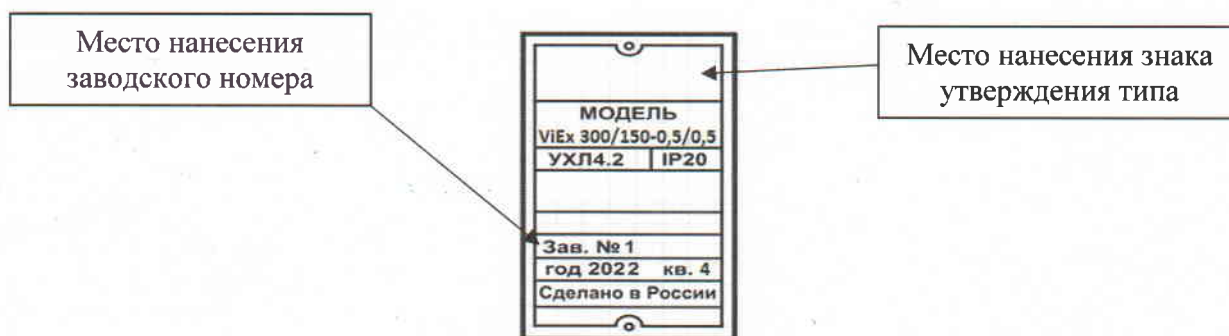
Рисунок 2 – Общий вид маркировочной таблички с обозначением мест нанесения знака утверждения типа и заводского номера

Общий вид маркировочной таблички с указанием мест нанесения знака утверждения типа средства измерений и заводского номера представлен на рисунке 2.